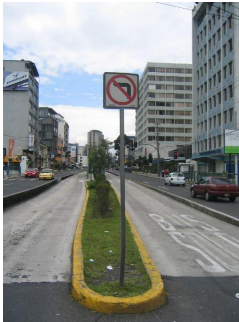
FOTOGRAFIA # 32 SEÑALIZACIÓN VERTICAL

La señalización horizontal es mas compleja pues restringe en el mismo pavimento del territorio de vehículos y peatones, en la actualidad estas normas son mas respetadas, siendo las mas importantes los pasos peatonales o cebras, desplazadas 10 cm de la esquina para permitir el paso de las personas evitando que en el mismo sentido del cruce existan obstrucciones al transito, otras señalizaciones horizontales es la línea de división entre los dos carriles con dos líneas amarillas.