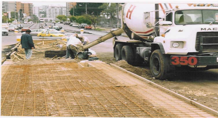
FOTOGRAFIA # 28 CONSTRUCCION DE UNA PARADA DE RUTA

El período de diseño toma en cuenta el incremento de tráfico en al vía y se considera este período desde su construcción hasta el momento de realizar el primer mantenimiento o reparación considerable, el diseño geométrico se lo hace para 20 años, el diseño de pavimento flexible se lo hace para 10 años y para pavimento rígido será para 50 años.