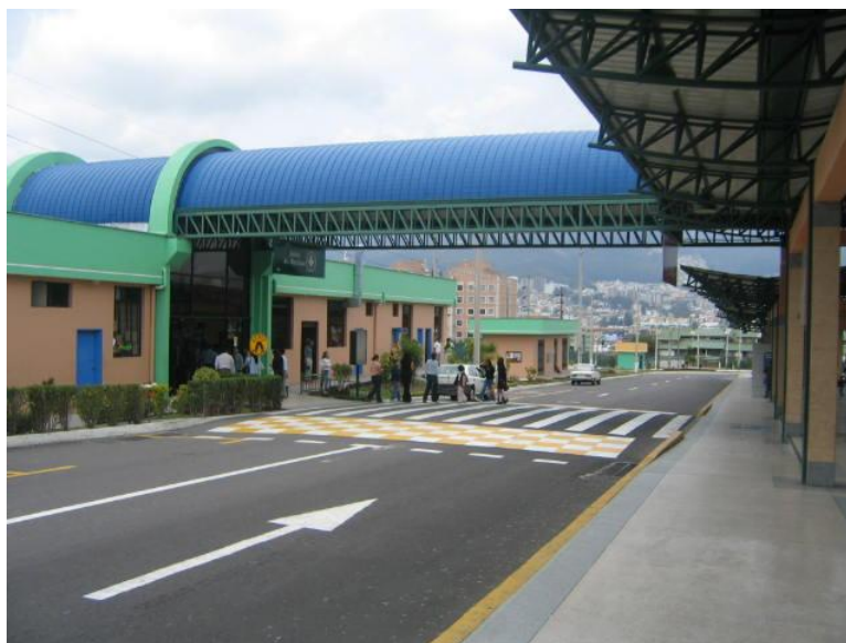
FOTOGRAFIA # 30 CARRIL LATERAL TERMINAL RÍO COCA