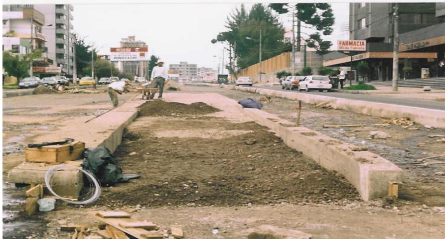
FOTOGRAFIA # 29 RELLENO DE UNA PARADA DE RUTA