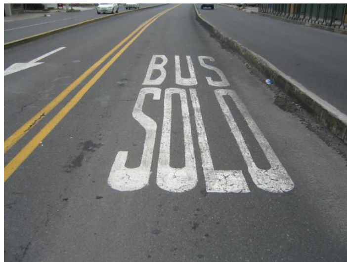
FOTOGRAFIA # 33 SEÑALIZACIÓN HORIZONTAL

La señalización horizontal es mas compleja pues restringe en el mismo pavimento del territorio de vehículos y peatones, en la actualidad estas normas son mas respetadas, siendo las mas importantes los pasos peatonales o cebras, desplazadas 10 cm de la esquina para permitir el paso de las personas evitando que en el mismo sentido del cruce existan obstrucciones al transito, otras señalizaciones horizontales es la línea de división entre los dos carriles con dos líneas amarillas.