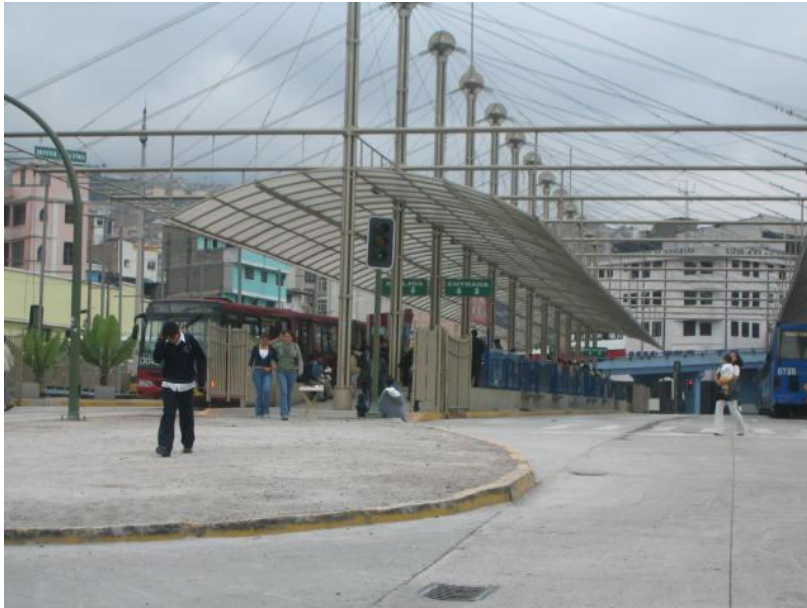
FOTOGRAFIA # 31 TERMINAL SUR LA MARÍN