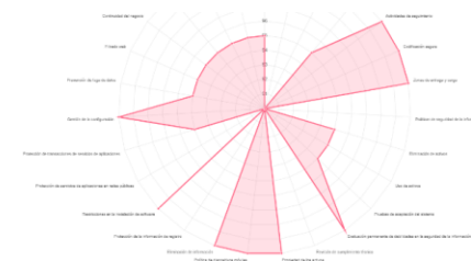
Tabla de Evaluación