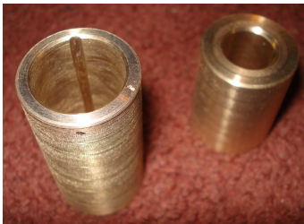
Bujes Punta de Eje