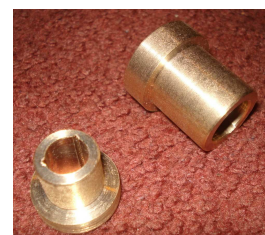
Bujes con Pestaña

Piezas Obtenidas: esta aleación pertenece a los bronce al estaño emplomados. Se utiliza principalmente en la industria para la fabricación de bujes, cojinetes y bocines. Es por ello que se fabrico diferentes bocines y de diferentes medidas para diferentes aplicaciones.