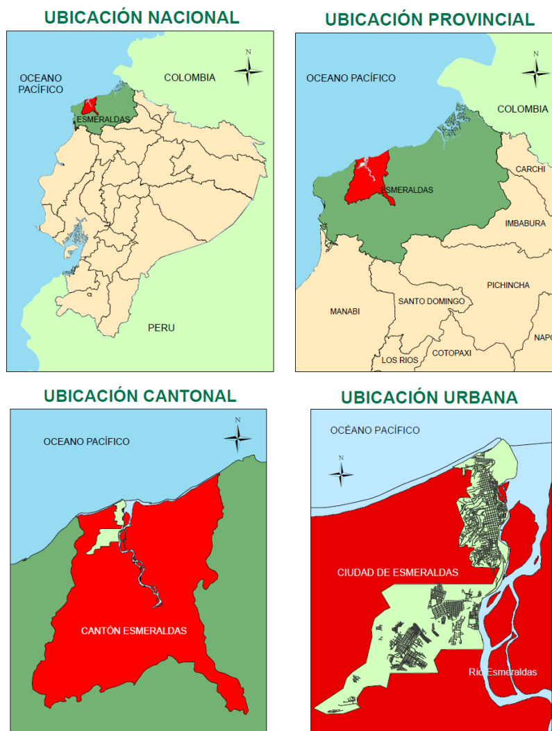
Figura 1. Ubicación de la ciudad de Esmeraldas.

La ciudad de Esmeraldas está situada en la costa noroccidental del Ecuador en la desembocadura del río Esmeraldas, es la capital de la provincia homónima (figura 1). Según el último censo de población y vivienda (INEC, 2010), la ciudad de Esmeraldas cuenta con 189.504 habitantes.