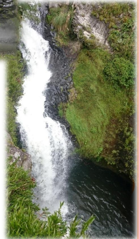
Cascada Cóndor Machay