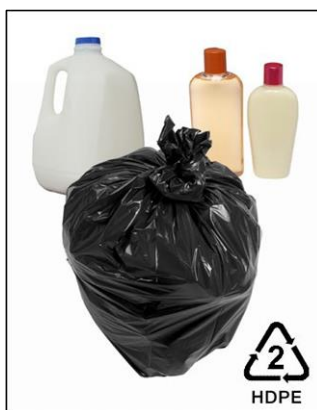
Figura 2 PET 2 ó HDPE