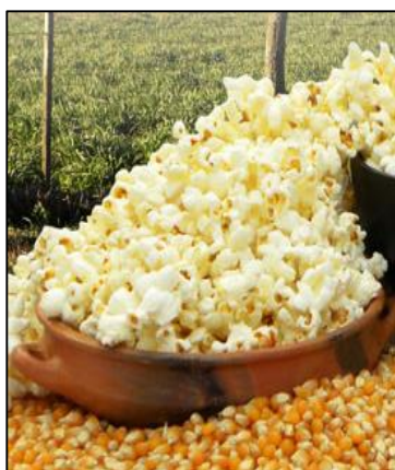
Figura 1 Maíz Reventón

El maíz tiene una gran variabilidad en el color del grano, textura, composición y apariencia, este producto es de gran importancia económica a nivel mundial ya sea como alimento humano o como alimento de ganado, este cereal es el segundo cultivo del mundo por su producción, después del trigo. (FAO, 2016)