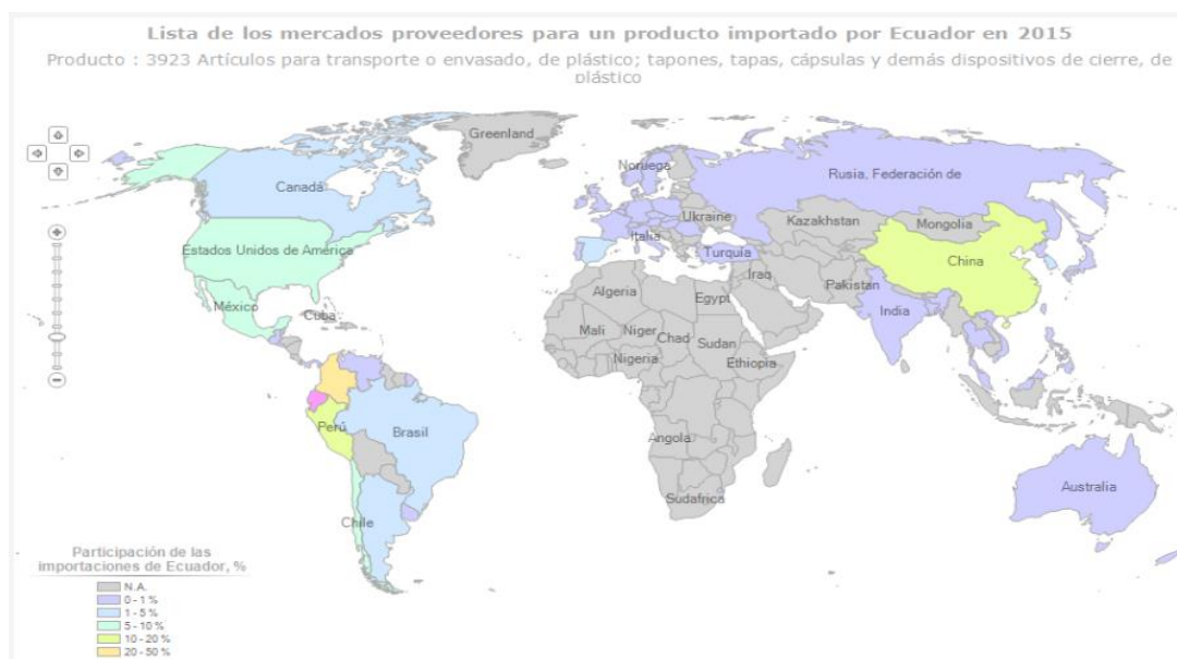
Figura 5 Mercados proveedores subpartida 3923.30.99.00 frascos plásticos