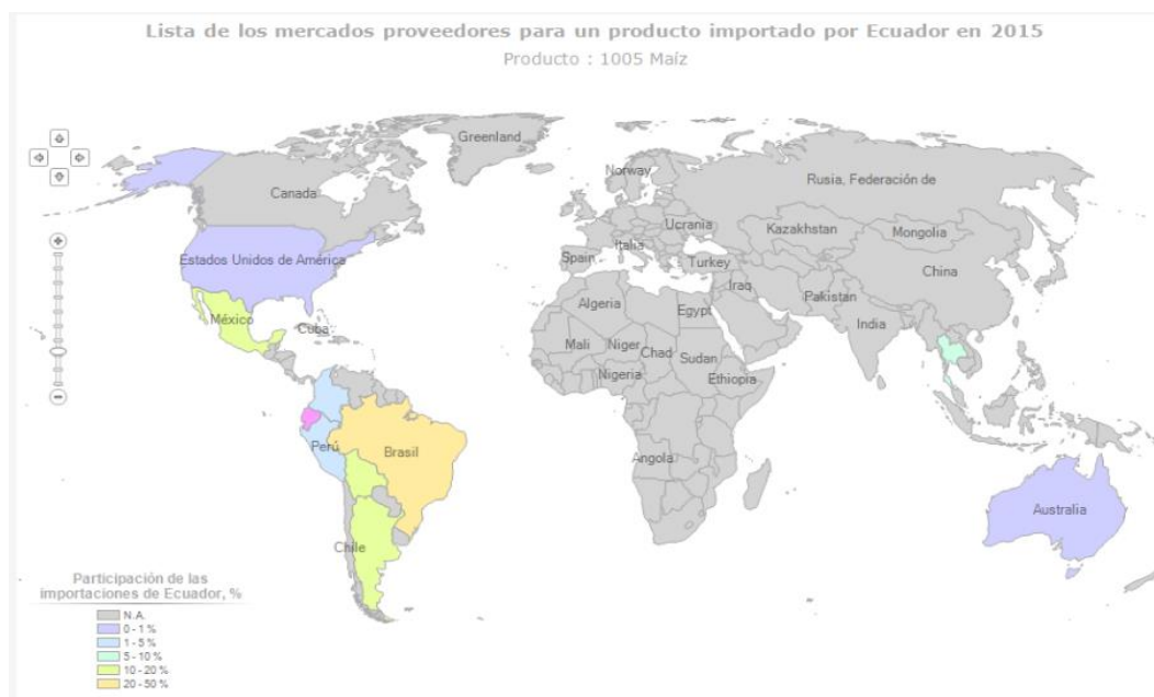
Figura 4 Mercados proveedores subpartida 1005.90.20.00 maíz reventón

Fuente: Base de Datos (TRADEMAP, 2015) Adaptado por: La Autora