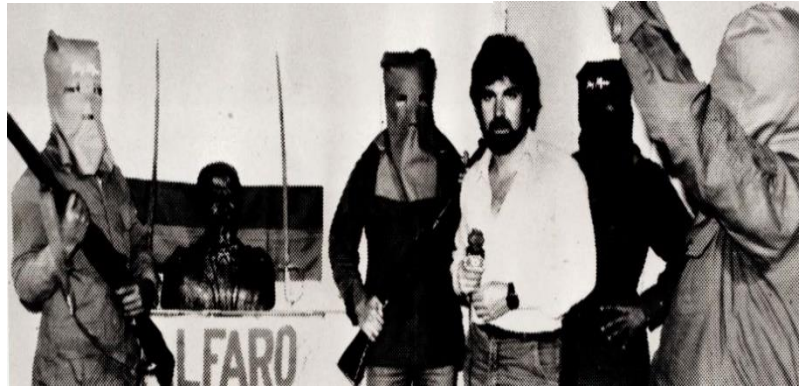
Miembros del Grupo Alfaró Vive Carajo

Es importante señalar que la arquitectura geopolítica mundial en los últimos años ha cambiado ya que actualmente en los estados han aparecido organizaciones no estatales que tienen el poder necesario dentro de los estados para rivalizar con éstos, cambiando el enfoque tradicional de la geopolítica entendida como la rivalidad entre estados en un espacio determinado a una rivalidad estado-organizaciones.