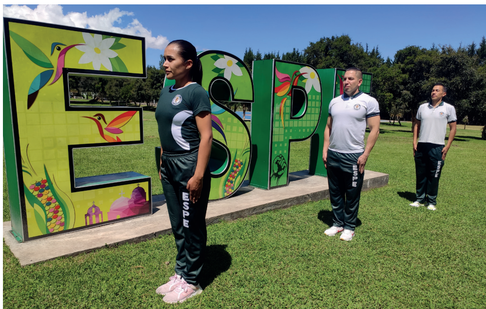
Postura de la montaña (Tadasana)