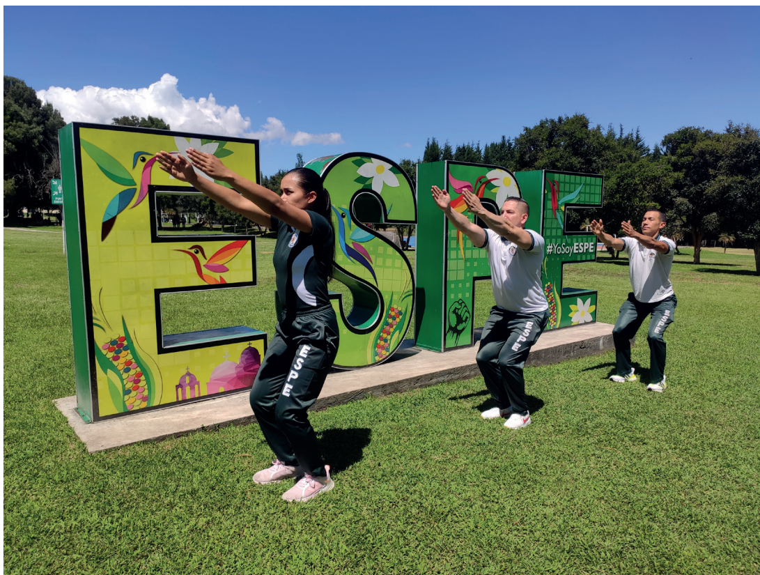
Postura de la silla (Utkatasana)