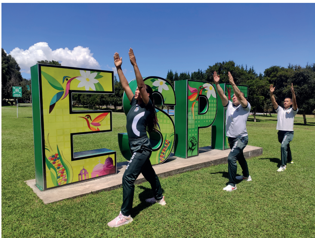
Posición del guerrero 1 (Virabhadrasana 1)