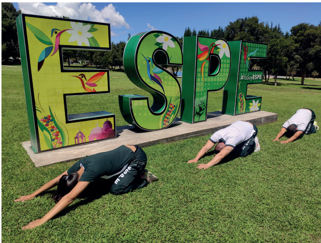
Postura del niño (Balasana)