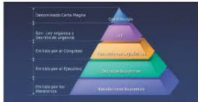
Pirámide de Kelsen a nivel nacional