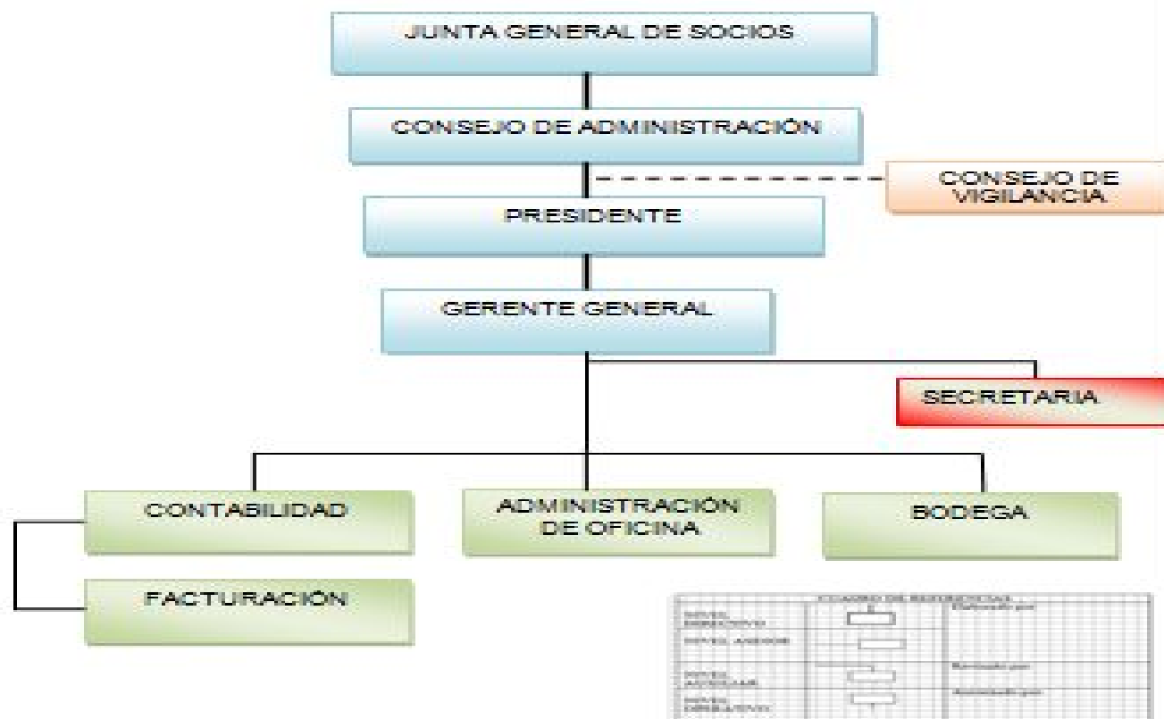
Figura. 14 Organigrama Estructural de la Cooperativa de Transporte Pesado "Los Andes" de la ciudad de Ambato.