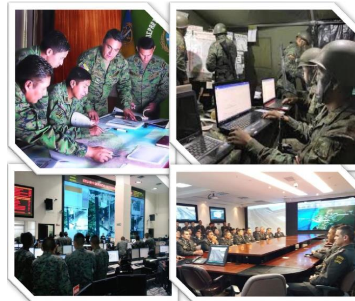
PRESUPUESTO PLANIFICADO AL 2025 CON INVERSIÓN EN MATERIAL DE GUERRA

Al 2033 ser una Fuerza Terrestre disuasiva, con características multimisión, con personal polivalente y medios multipropósito; promoviendo de forma permanente los principios, los valores y el comprometimiento con la sociedad, observando el respeto a los derechos humanos y garantías de los ciudadanos, contribuyendo a la integración, defensa, seguridad del Estado y posicionada en la cooperación internacional para el mantenimiento de la paz.