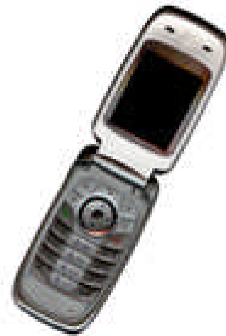
Fig. 2 Ejemplo de figura con baja resolución

Fig. 2 muestra un caso donde la resolución no es adecuada, mientras que Fig. 3 muestra una mejor adaptación de la misma figura.