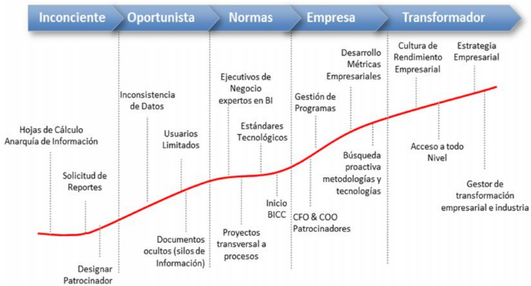
Figura No. 3. Modelo de Madurez de Gartner para BI & PM (Agosto 2010)

Tomando en cuenta ello, por ejemplo (Gartner 2010) establece el siguiente modelo de madurez: