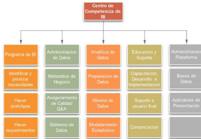
Figura No. 2. Organización BICC (Hostmann 2007)