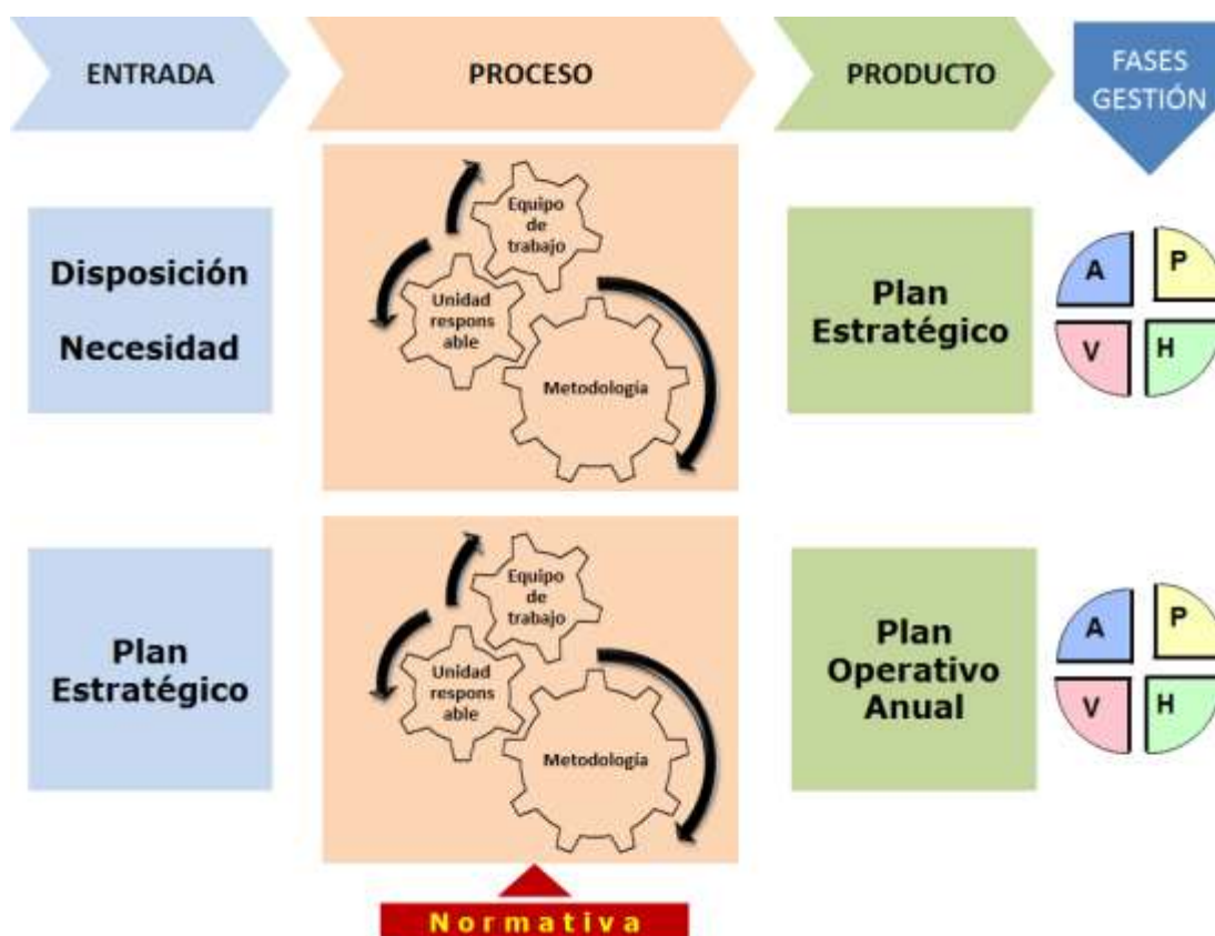
ILUSTRACIÓN No. 2. Enfoque de sistemas y fases de la gestión de la planificación estratégica y operativa

Sobre la base del enfoque de sistemas y mediante el gráfico correspondiente en el que constan unificados los procesos de formulación, ejecución y evaluación del plan estratégico y del plan operativo anual, a continuación se describen los resultados de la investigación: