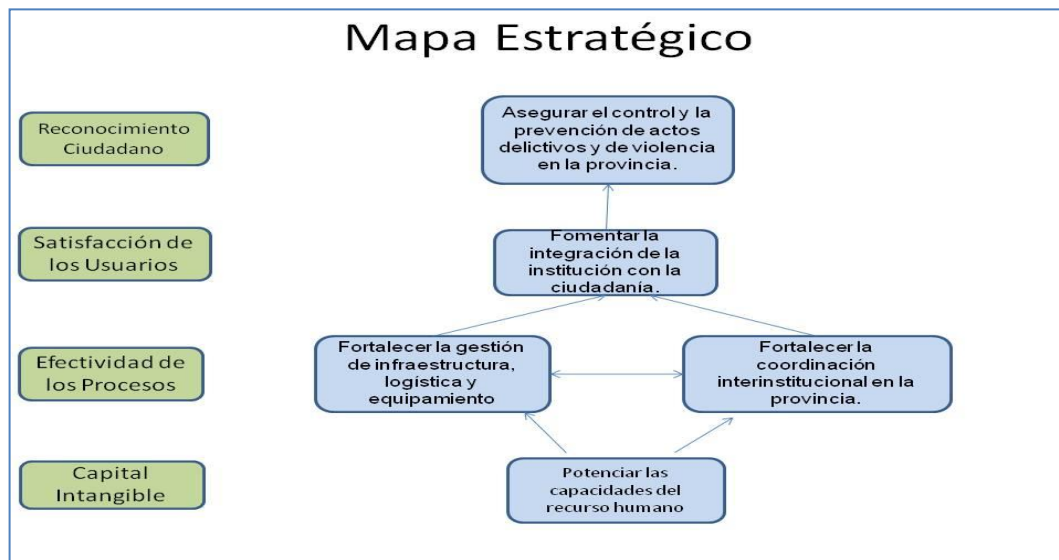
Figura 4.2: Mapa estratégico del CP-19

Cuadro de Mando Integral nos permite describir la estrategia y realizar el primer paso para ejecutar con éxito nuestra estrategia a toda nuestra organización.